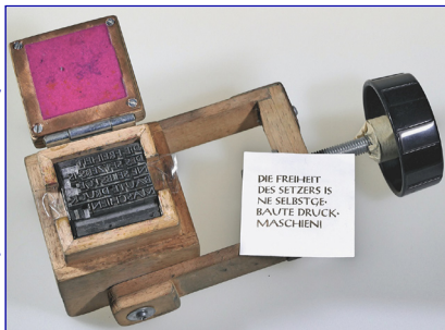
Die Klappbügelpresse mit Bleibuchstaben und Druck.

Am 5. Januar nähern wir uns, in der „Buchstadt St. Gallen“, dem Geheimnis des 500 Jahre alten Buchdrucks. Wie seit den 1520ern setzen wir Letter an Letter zu einem Text. Wir drucken auf/mit verschiedenen Pressen, von der (bekannten) 4x4cm Klappbügelpresse bis hin zur (englischen) Adana 8 x 5“. Es stehen zwei Schriftsätze zur Verfügung, wir setzen auf 105 Punkt Breite = 39.48 mm.