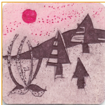
Das Klischee zum Druck auf der Vorderseite.