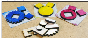
Holz-Reste, Druckplatten vom Bild oben rechts.