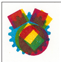
3-farbiger Hand-Druck Von Holz-Resten.

Bindfäden, Reiskörner, (Sperr-)Holzreste vom lasern, ...eben alles, was irgendwie die gleiche Höhe hat.