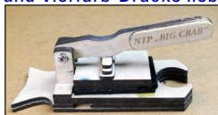
„BigCrab“, eine Nano-Tortilla-Pressen.

Wenn Du Dich begeistern lässt und grössere Formate, oder Mehr- und Vierfarb-Drucke liebst: jeder Tag ist ein Druck-Montag (nach Absprache). Diese individuellen Kurse können ab CHF 30.- / Person, für alle Handdruck-Techniken gebucht werden.